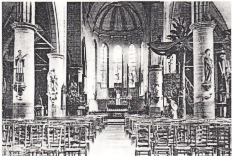
Binnenzicht der kerk.