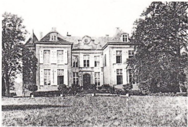
Het Kasteel van Loenhout.