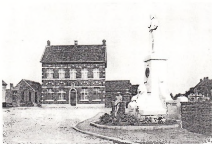
Het Nonnenklooster en H. Hartbeeld.