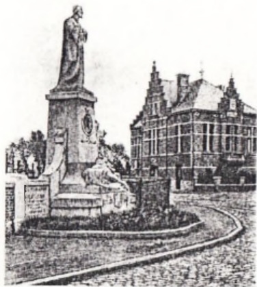
Gemeentehuis en Oorlogsgedenkteeken.